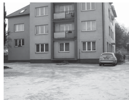
Oprava přístupové cesty a parkoviště u bytového domu č.p. 397 na ul. Školní

Město Slušovice finančně podpořilo lampionový průvod částkou 6 000 Kč na úhradu ohňostroje. Dalším příspěvkem města ve výši 5 000 Kč byla podpořena akce rozsvícení vánočního stromu u ZŠ.